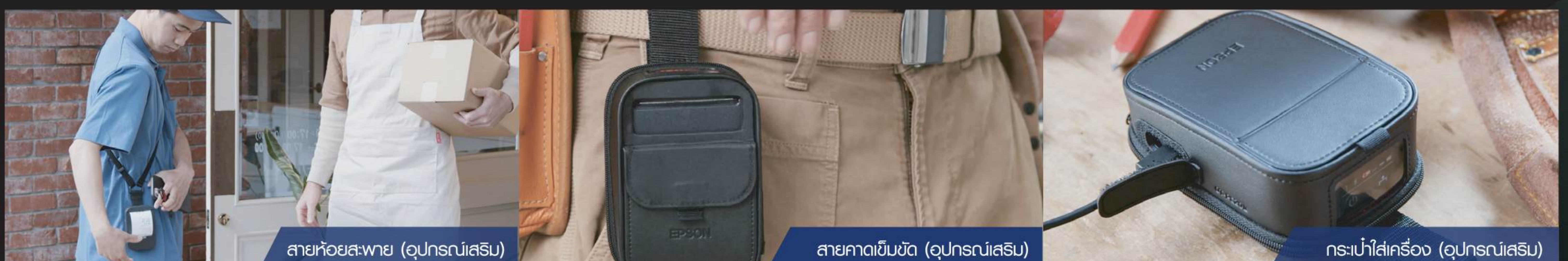
สายห้อยสะพาย (อุปกรณ์เสริม)