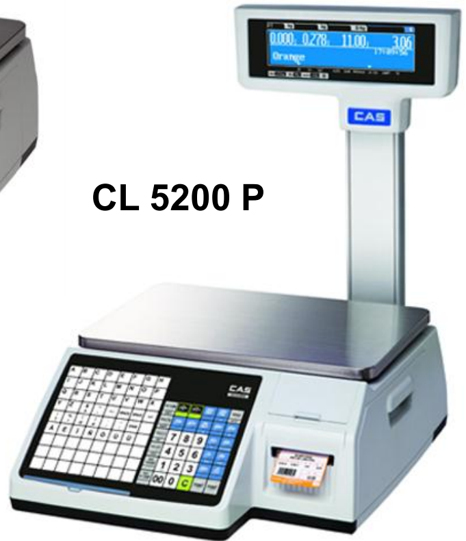
CL 5200 P