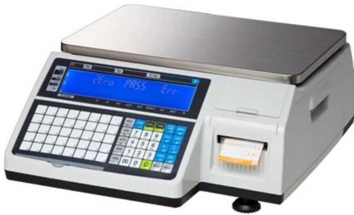
CL 5200 B