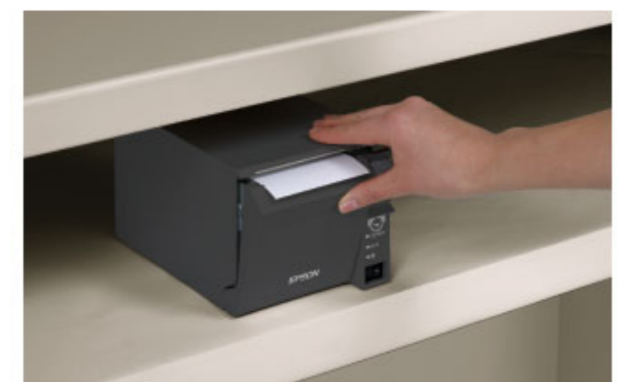
ชุดควบคุมสำหรับผู้ใช้งานที่ด้านหน้า

© 2013 Epson Singapore Pte Ltd สงวนลิขสิทธิ์ ห้ามทำซ้ำ ในบางส่วนหรือทั้งหมด โดยไม่ได้รับความยินยอมเป็นลายลักษณ์อักษรจาก Epson