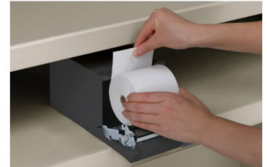
ชุดป้อนกระดาษด้านหน้าพร้อมที่ใส่ม้วนกระดาษ